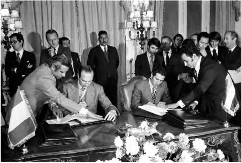
أثناء توقيع اتفاقات بين رئيس وزراء ليبيا عبد السلام جلود ونظيره الفرنسي جاك شيراك، في مجالات الاقتصاد والتكنولوجيا والثقافة والاهتمامات المشتركة بين البلدين.